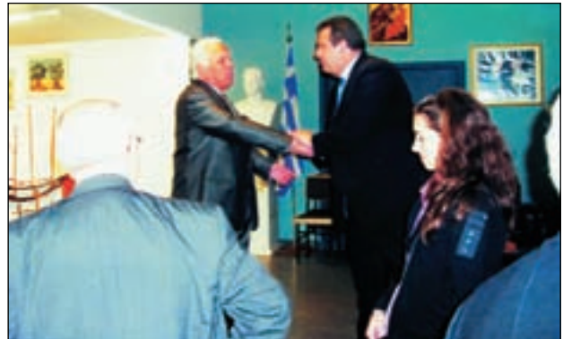
Ο Υφυπουργός Ε.Ν.Α.Ν.Π. Πάνος Καμμένος συγχαίρει τον Υποναύαρχο Λ.Σ. (ε.α.) Γ. Σπαρτιώτη για τα εντυπωσιακά έργα του στην έκθεση "Καράβια από αλίκυττα ξύλα"