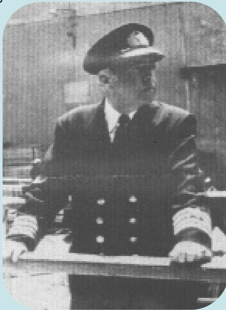
Ο Δ.Ι. Αντωνίου

νέες βάσεις. Ποιήματά του καταχωρίστηκαν σε όλες τις ανθολογίες, μεταφράστηκαν σε ξένες γλώσσες και το έργο του απασχόλησε όλους τους ιστορικούς μελετητές της νεοελληνικής λογοτεχνίας. Ο καθηγητής Π.Δ. Μαστροδημήτρης στην "Εισαγωγή" του στη νεοελληνική φιλολογία αναφέρει: "Η θαλάσσια αποδημία συνιστά το οργανικό πλαίσιο της ποίησης του Δ.Ι. Αντωνίου, που ξένος σε κάθε τάση ωραιολογίας, αναζητεί ένα νόημα ζωής μέσα στη δίψα της αποδημίας και τις πικρές καθημερινές εμπειρίες της" (σελ. 122). Ο Ι. Μ. Χατζηφώτης στη "Μεγάλη Εγκ. Νεοελλ. Λογοτεχνίας" (τόμ. 2, σελ. 208) σημειώνει: "Ο Αντωνίου θεωρείται ο μοναδικός αξιολογός, που έδωσε συγχρόνως ποίηση και που ακολούθησε τα καλλιτεχνικά ρεύματα του καιρού του... Μαζί με τον Σεφέρη, τον Ελύτη και ένα δύο άλλους, αποτελούν τη βασική εκείνη ομάδα των νεοελλήνων ποιητών, που με το έργο τους συνέβαλλαν ουσιαστικά στην ανανέωση του λυρικού ποιητικού μας λόγου και χάραξαν στην ποίησή μας νέες γραμμές.... Επίδραση όμως του Σεφέρη δεν παρατηρείται στην ποίηση του Αντωνίου. Κοινή πορεία ναί. Δημιουργία σε πλαίσια σύγχρονα, ευρω-