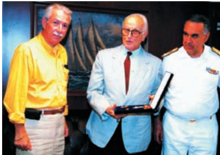
Από αριστερά, ο επίτιμος Αρχηγός Λ.Σ. κ. Σιωνίδης, ο επίτιμος Αρχηγός Λ.Σ. κ. Σκιαδάς και ο Αρχηγός Λ.Σ. Αντιναύαρχος κ. Θεόδωρος Ρεντζεπέρης.

Από την πρώτη στιγμή αγάπησε τη ναυτιλία και αγκάλιασε το ΛΣ και τα προβλήματά του. Είχε απέραντη κατανόηση και υπήρξε πρόθυμος και ένθερμος αποδέκτης