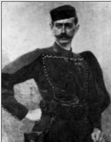
Ο Παύλος Μελάς

Ο Μακεδονικός αγώνας έδωσε τότε στην ελεύθερη Ελλάδα τη δυνατότητα να επικαλείται την ελληνικότητα της Μακεδονίας στα διεθνή συνέδρια, και να πραγματοποιήσει το μεγάλο μας όνειρο με τους νικηφόρους βαλκανικούς πολέμους.