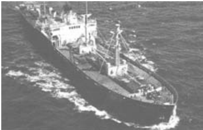
Το Liberty που θα δωρηθεί στην Ελλάδα

"Κι εγώ νομίζω ότι σήμερα είναι μια σημαντική μέρα για τις δύο χώρες, την Αμερική και την Ελλάδα, που δωρίζουμε το τελευταίο "Liberty" και προχωράμε με ένα ιστορικό γεγονός, ένα πολύ σημαντικό γεγονός, που δεν θα το ξεχάσουμε!"