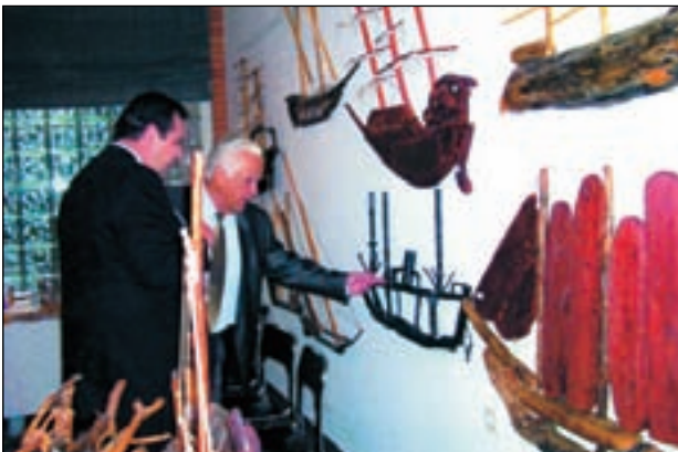
Ο δημιουργός Υπον/ρχος Λ.Σ. (ε.α.) Γ. Σπαρτιώτης δεικνύει το έργο του LIBERTY, στον Υφυπουργό Ε.Ν.Α.Ν.Π. Πάνο Καμμένο