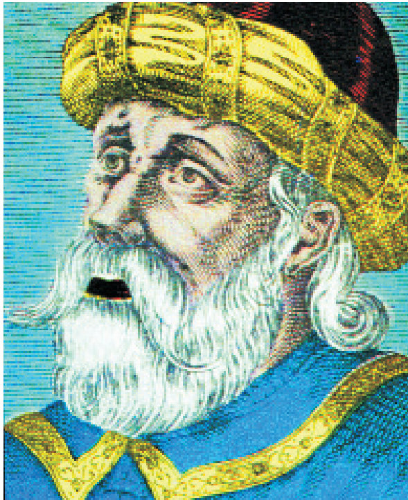
Ο αυτοκράτορας Κωνσταντίνος Παλαιολόγος

Όμως τα προνόμια αυτά οδήγησαν στην ανάπτυξη τάξεων επιχειρηματιών και εμπόρων, οι οποίοι συνεργάζονταν εμπορικά με τους Λατίνους και σταδιακά αυτονομούνταν από το κράτος και τα όργανά του. Ευρύτερα τα προνόμια βοήθησαν τους οικονομικά ισχυρούς να αποκτήσουν πλούτο και γη και να παραμερίσουν το κράτος. Αυτό το φαινόμενο του οικονομικού επεκτατισμού στην Πελοπόννησο ενισχύθηκε πολύ με τους τοπάρχες, επειδή απουσίαζε η δυναμική διοικητική αρχή. Οι τάξεις των τοπαρχών και οι μεταξύ τους έντονοι ανταγωνισμοί, ήλθαν σε σύγκρουση με τα μέτρα του κράτους προς τις οικονομικά ασθενέστερες τάξεις, οι οποίες αντιμετώπιζαν τα ξένα στοιχεία, που είχαν χειροδύσει στην Πελοπόννησο (Σλάβοι και Αλβανοί) και τελούσαν υπό το κράτος εθνικού αναβρασμού.