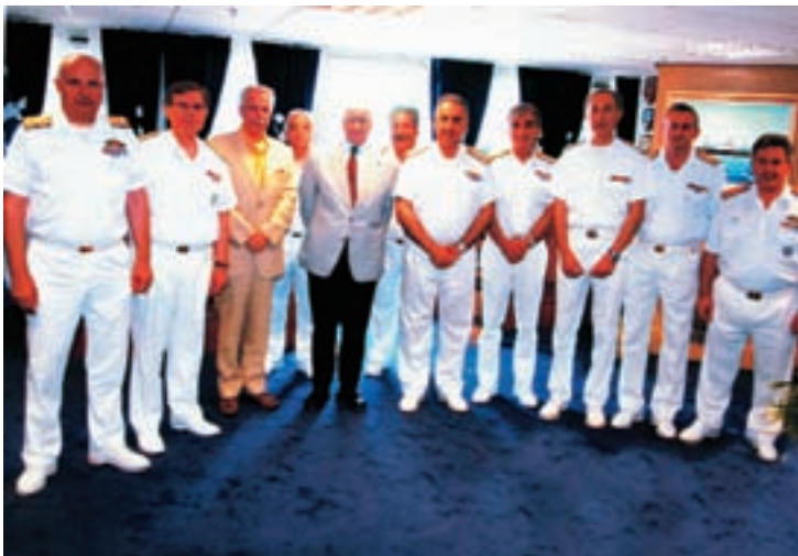
Στη φωτογραφία ο επίτιμος Αρχηγός ΛΣ Αντιναύαρχος κ. Άλκης Σκιαδάς εν μέσω του Αρχηγού κ. Θεόδωρου Ρεντζεπέρη και της λοιπής ηγεσίας του Λιμενικού Σώματος καθώς και του Επίτιμου Αρχηγού ΛΣ Αντιναύαρχου κ. Ηλία Σιωνίδη που τιμήθηκε επίσης με τον Αστέρα Αξίας και Τιμής.