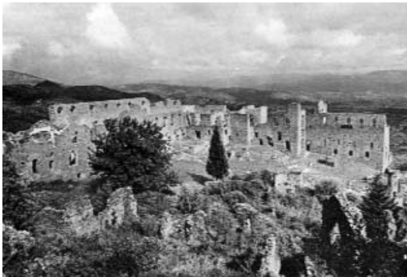
Μυστράς. "Τα παλάτια"

Οι Οθωμανοί, το 1387, μπήκαν στην Πελοπόννησο και τρομοκράτησαν τους κατοίκους, ενώ ο δεσπότης της έδωσε από τις κτήσεις τους πολλούς άρχοντες, όπως τον Μαμωνά, ο οποίος,