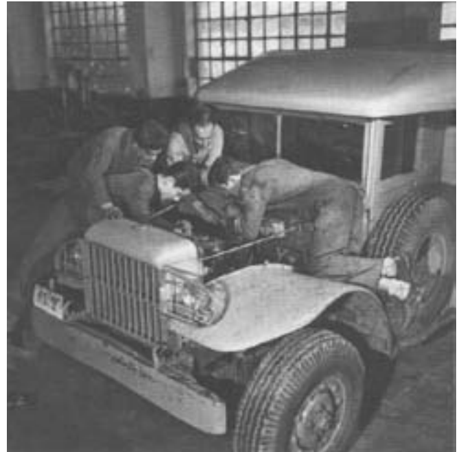
LAND ROVER Λ.Σ.

•Εντοπιότητα. Η κυβέρνηση προσανατολίζεται στην επαφορά του κωλύματος της εντοπιότητας στις μεταθέσεις,