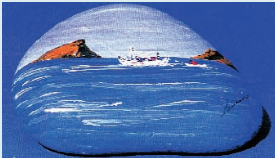
Ζωγραφική πάνω σε πέτρες