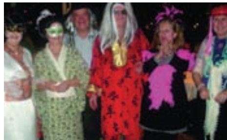
Στηγμιότυπο από το αποκριάτικο γλέντι (μασκέ) την Κυριακή το βράδυ σε αίθουσα του ξενοδοχείου.

τερες και όμορφες στολές τους, δίνοντας έτσι ένα ιδιαίτερο τόνο στην ψυχαγωγία μας.