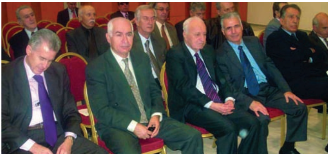
Επίτιμοι Αρχηγοί Λ.Σ. κατά την κοπή της Πρωτοχρονιάτικης πίτας της ΕΑΑΛΣ