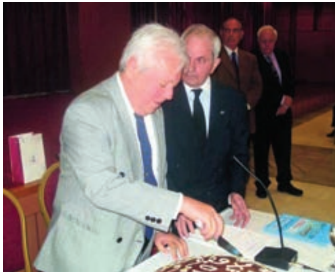
Ο Πρόεδρος της ΕΑΑΛΣ Υποναύαρχος Λ.Σ. κ. Γεώργιος Καλαρώνης κόβει την πρωτοχρονιάτικη πίτα της ΕΑΑΛΣ

Ελπίζω και εύχομαι, άλλοι πιο τυχεροί από μας, να αξιωθούν και να εορτάσουν με πλέον λαμπρό τρόπο τα 100 χρόνια του Σώματος το 2019, όταν η καταϊγίδα θα έχει κοπάσει, ο κλυδωνισμός που ήδη μας δοκιμάζει θα είναι παρελθόν και το σήμερα θα μοιάζει κακό όνειρο.