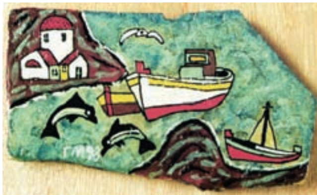
Γ. Μητράκου: "Βάρκα στο λιμάνι"