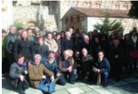
Ομάδα εκδρομής στο προαύλιο της Ιερής Μονής Οσίου Λουκά πλαισιώνει τον Πρόεδρο της ΕΑΑΛΣ Υποναύαρχο Λ.Σ. ε.α. κ. Γεώργιο Καλαρώνη.

Τα δύο βράδια (Σαββάτου και Κυριακής) τα περάσαμε στο ωραίο ξενοδοχείο DELPHI BEACH διασκεδάζοντας στους ρυθμούς της αποκριάς, με ζωντανή μουσική, ενώ πολλοί συνάδελφοι έκαναν εντυπωσιακές και ωραίες μεταμφιέσεις (μασκέ). Την παράσταση βέβαια έκλειψαν όπως κάθε χρόνο οι γυναίκες μας με τις ιδιαί-