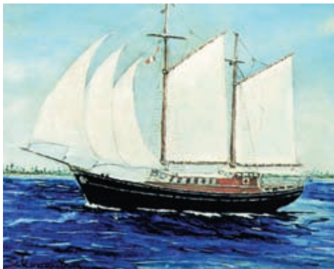
Χ. Κοκορέτσα: "Ιστιοφόρο"