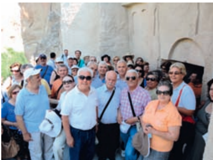
Έξω από τον ιερό ναό του Αγίου Στεφάνου στο Κόραμα (Goreme) της Καππαδοκίας

Καππαδοκία (Τουρκικά Karadokya, από το Ελληνικό: Καππαδοκία / Kappadokia, που με τη σειρά του προέρχεται από το Περσικό: Καππατούκα που σημαίνει "η χώρα των όμορφων αλόγων") είναι μία ξεχωριστή, αλλά και μία από τις μεγαλύτερες περιοχές της ανατολικής Μικράς Ασίας. περιλαμβάνει τέσσερις διοικήσεις, την Καισάρεια, τη Νίγη, το Γκιοζγκάτ και