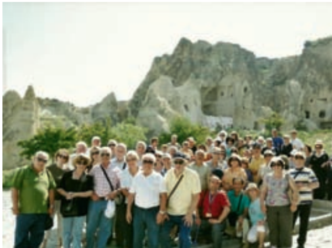
Στο υπαίθριο μουσείο Κοράμματος (Goreme) με φόντο μερικές εκκλησίες και ασκητήρια

Ακολούθησαν οι επισκέψεις μας στο φαράγγι του Περιστρέματος και την κοιλάδα της Ιχλάρα (χλωρού) (ixlara vadisi) ή περίστρεμα όπου βρίσκονται οι εκκλησίες του Αγίου Γρηγορίου του Ναζιανζηνού, του Προφήτη Δανιήλ και των φιδιών, στην Καρβάλη (Guzel Xurt), που ήταν κέντρο εμπορίου από