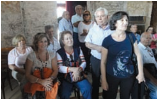
Στο εσωτερικό του Βυζαντινού ναού, παρακολουθώντας την δέηση

Κατά τη διάρκεια της εκδρομής επισκεφθήκαμε και προ-