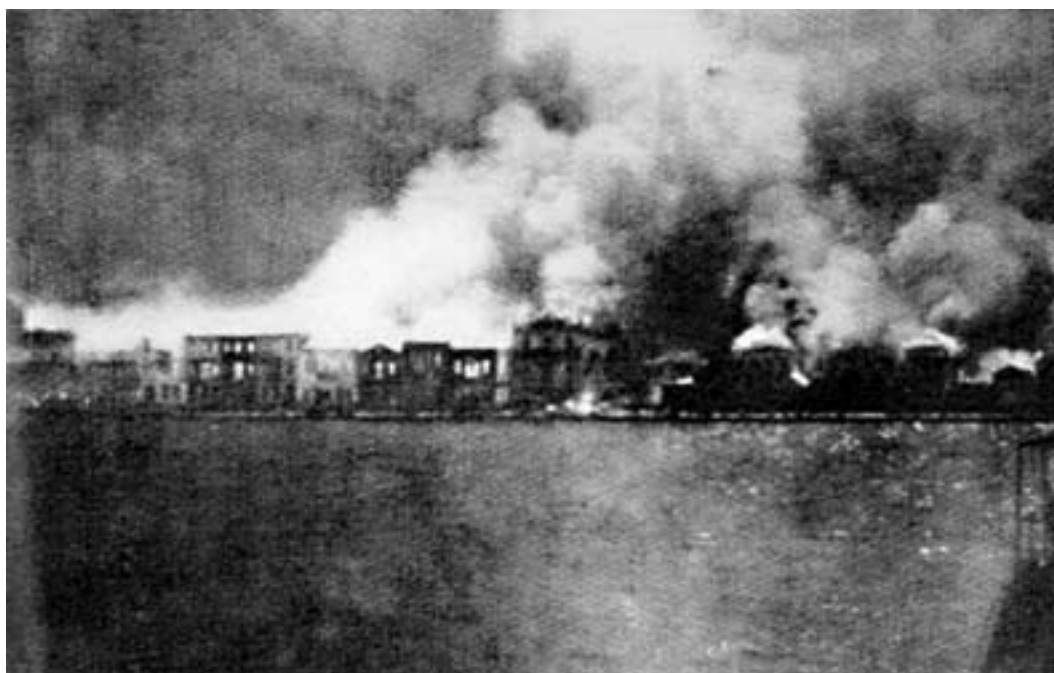
Πέμπτη 14 Σεπτεμβρίου 1922 Η Σμύρνη καίγεται