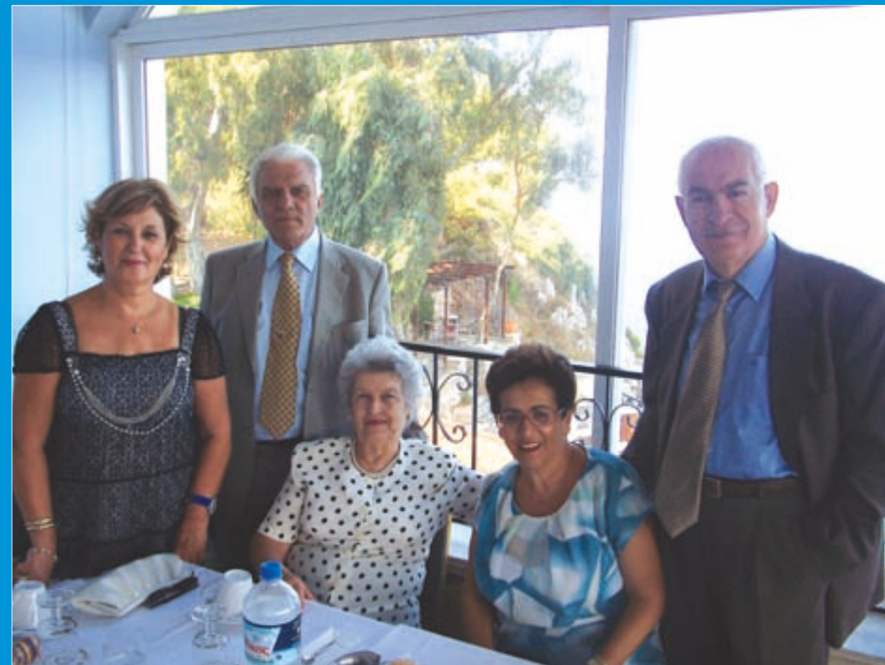
Στιγμιότυπο από εορταστικές εκδηλώσεις Αγίου Φανουρίου Πύλου