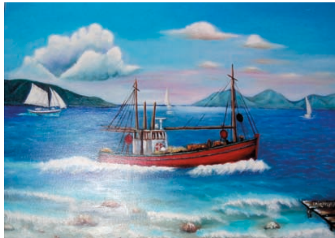
Υποναύαρχου Λ.Σ. (ε.α.) Ι. Μάρκελλου "Ψαράδικο"

Φωτογραφία εξωφύλλου: Ψαριανή Γαλλιότα που χρησιμοποιήθηκε κατά τη Επανάσταση του 1821