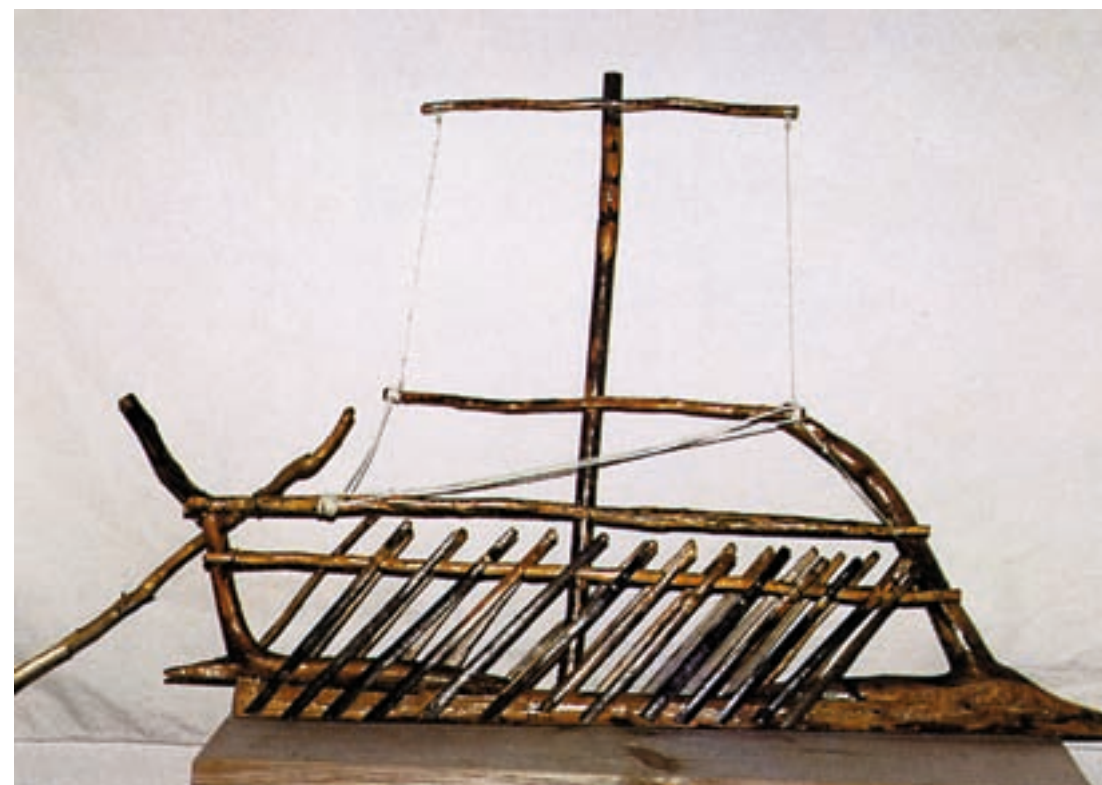
Υποναύαρχου Λ.Σ. (ε.α.) Γ. Σπαρτιώτη "Τριήρης 1"