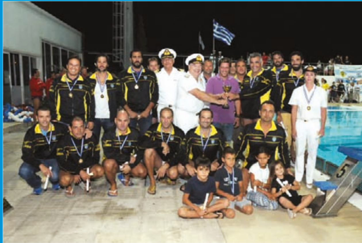
Στιγμιότυπο από την αθλητική δραστηριότητα του Λ.Σ.