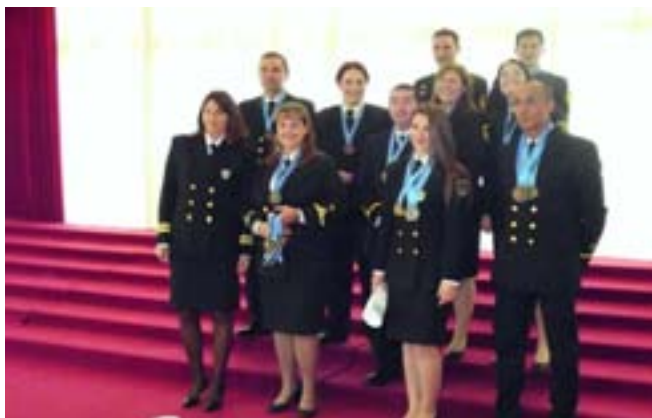
Ομάδα Σκοποβολής Λ.Σ. - ΕΛ. - ΕΚΤ.