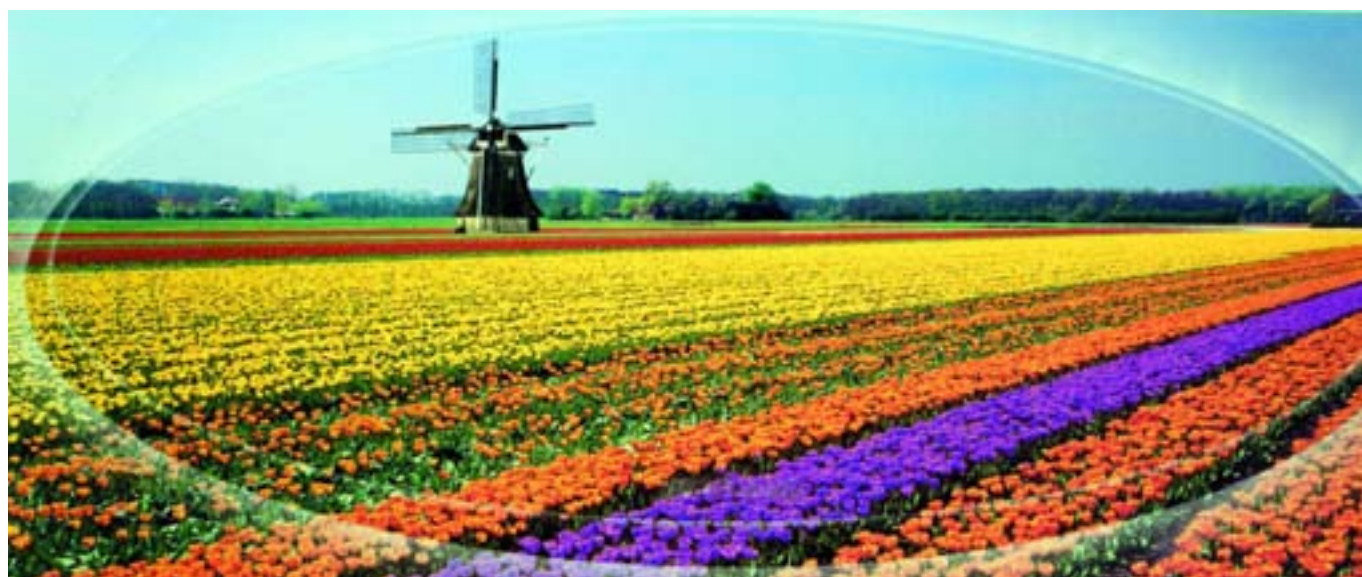
Ολλανδία: Η μαγική χώρα της τουλίπας