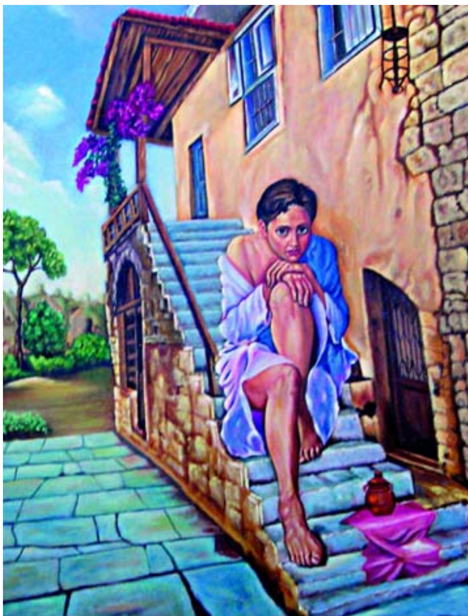
Υποναύρχου Α.Σ. (ε.α.) Γιάννη Μάρκελλου: «Περίσκεψη»