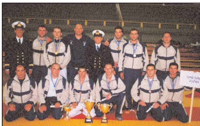
ΟΜΑΔΑ ΤΖΟΥΝΤΟ Λ.Σ.

Την ευθύνη διοργάνωσης των αγώνων στο κλειστό γυμναστήριο ΜΕΤΣ που έγιναν την 25-10-2003 και σημειώ-