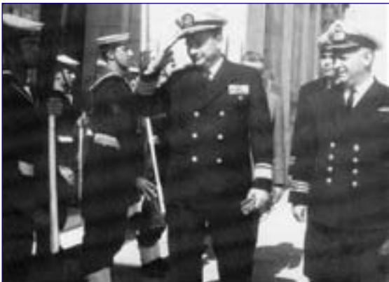
Ο Αμερικανός Υποναύαρχος I.C.KIDD προσερχόμενος εις Κ.Λ. Ρόδου