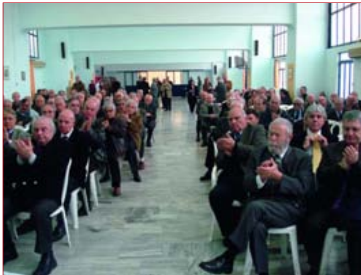
Στιγμιότυπο από τη Γενική Συνέλευση

Την παρουσίαση του απολογισμού του έργου και των πεπραγμένων της ΕΝΩΣΗΣ για τη χρονιά που πέρασε έκανε ο Αντιπρόεδρος της ΕΑΑΛΣ Υποναύαρχος Λ.Σ. ε.α. ΚΑ-