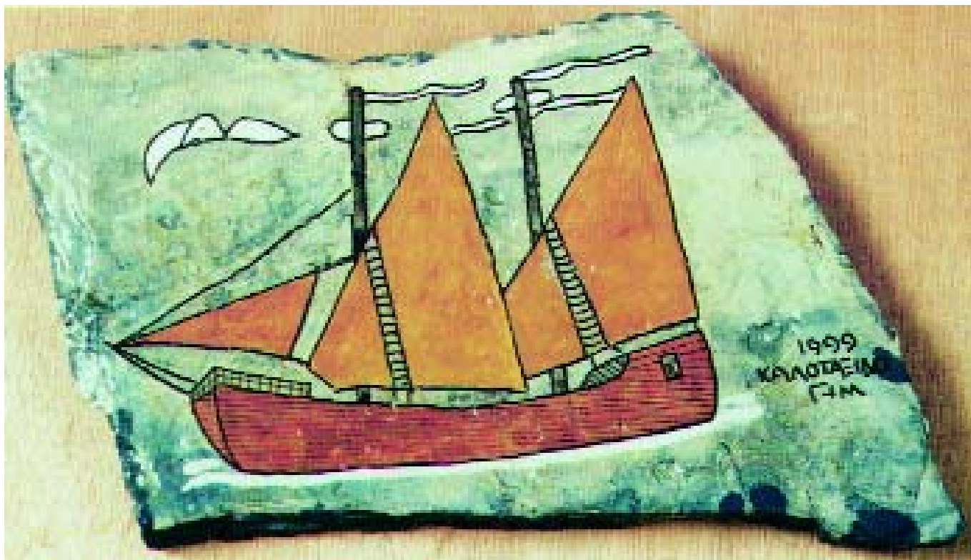
Εμπορικό καράβι του 4ου αιώνα μ.Χ. της Ανατολικής Μεσογείου