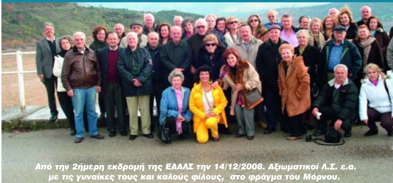
Από την 2ήμερη εκδρομή της ΕΑΑΛΣ την 14/12/2008. Αξιωματικοί Λ.Σ. ε.α. με τις γυναίκες τους και καλούς φίλους, στο φράγμα του Μόρνου.