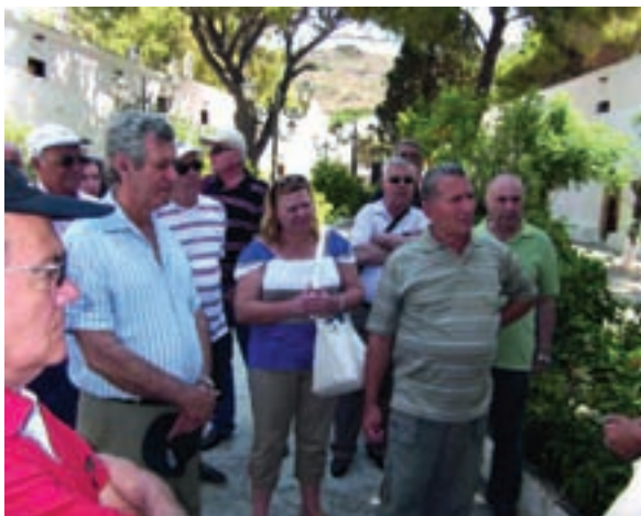
Από την ξενάγηση στην Ιερά Μονή Μυρτιδιώτισσας