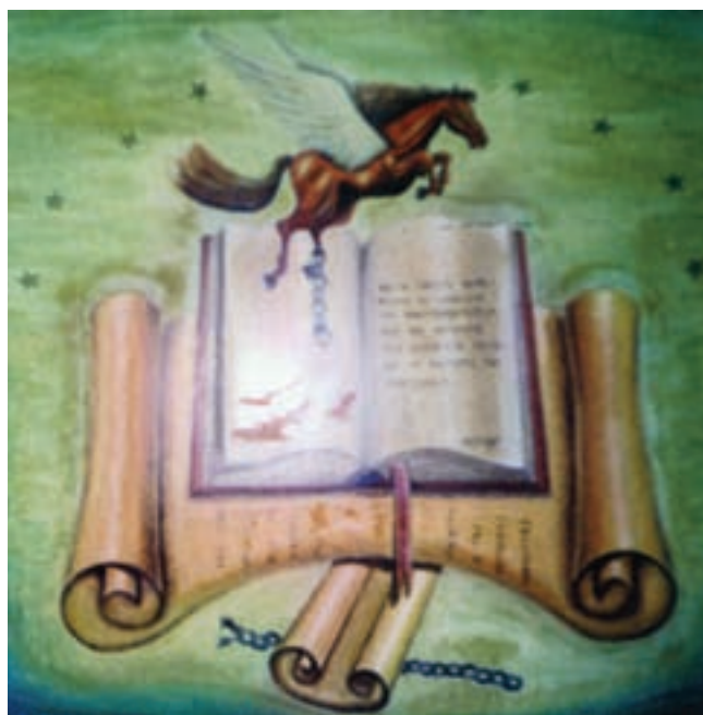
“Πήγασος”, 70 χ 70 εκ.