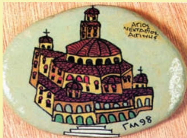
Αίγινα. Ο Ναός του Αγίου Νεκταρίου