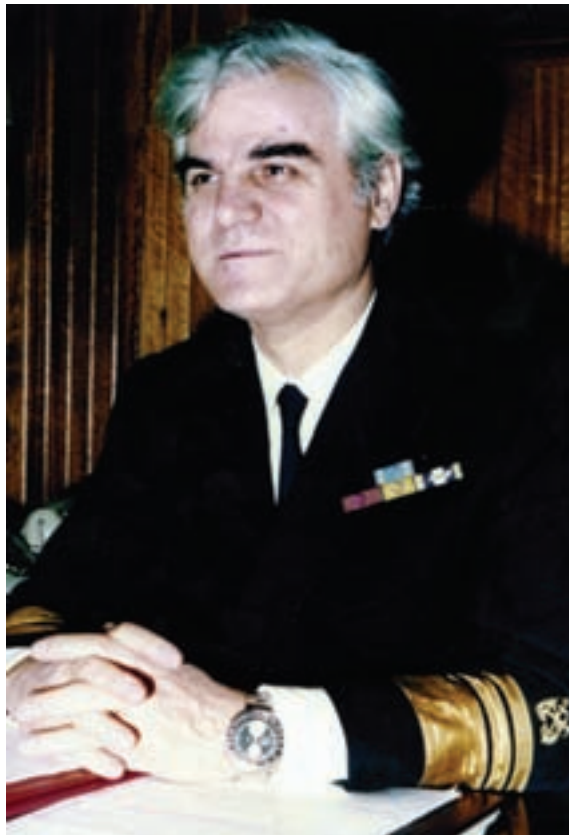
Ο Αντιναύαρχος - Αρχηγός Λ.Σ. Χρήστος Ντούνης

κού από πεδία ναυτικής γνώσεως και πειθαρχίας σε χώρους ακράτου συνδικαλισμού, ο Νόμος 1376/83 περί ανακυκλώσεως των πληρωμάτων, η απομάκρυνση των Λιμενικών Αξιωματικών από τα ασφαλιστικά ταμεία, Οίκο Ναύτου κλπ., τα οποία επιμελώς και χωρίς οικονομικό κόστος δι' αυτά επί σειρά δεκαετιών εξυπηρετούσαν, η α-