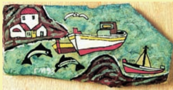
Βάρκα στο Λιμάνι