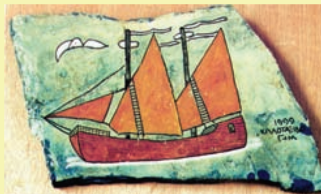
Εμπορικό καράβι του 4ου αιώνα μ.Χ. της Ανατολικής Μεσογείου