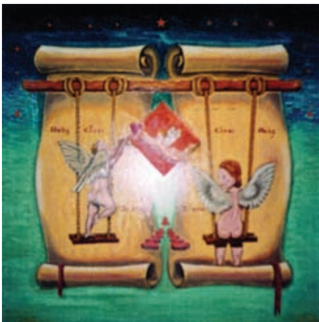
“Ο Θεός είναι αγάπη”, 70 χ 70 εκ.