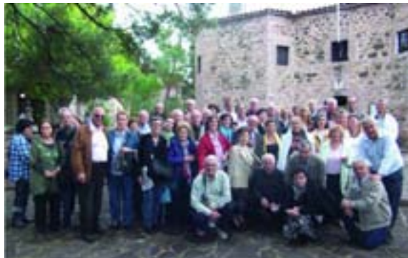
Οι εκδρομείς έξω από την Ιερά Μονή Παμμεγίστων Ταξιαρχών στο Μανταμάδος της Λέσβου

Οι συμμετέχοντες σ' αυτή την ειδική εκδρομή, ενθουσιασμένοι με τις εμπειρίες στο νησί, εξέφρασαν την επιθυμία, το προσκύνημα αυτό να επαναλαμβάνεται κάθε χρόνο από την ΕΑΑΛΣ.