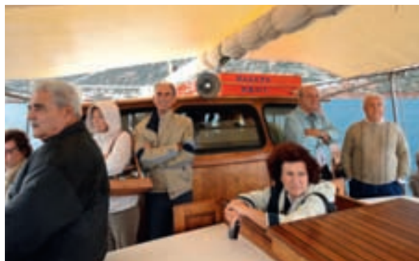
Από την ξενάγηση στον αρχαιολογικό χώρο της Κνωσού

Η μαντινάδα στον πρόλογο του Γιάννη Συκιανάκη είναι πολύ εύστοχη, αφού με δυο στίχους αποδίδει το μεγαλείο της Κρήτης.