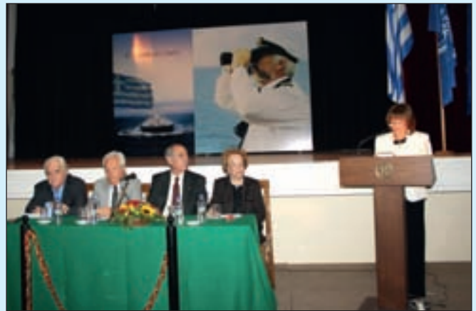
Στιγμιότυπα από την τελετή της Επετείου της 28ης Οκτωβρίου 1940 για το Λιμενικό Σώμα στον Πειραιϊκό Σύνδεσμο (2 Νοεμβρίου 2011)

Και οι δυο ομιλητές με την ευκαιρία της εθνικής επετείου που