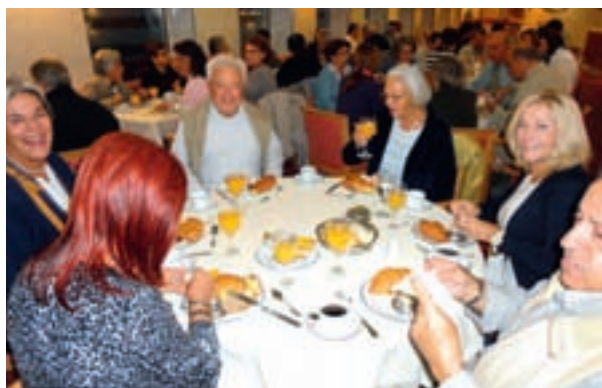
Από το πρωινό στην τραπεζαρία του H/SIF KNOSSOS PALACE