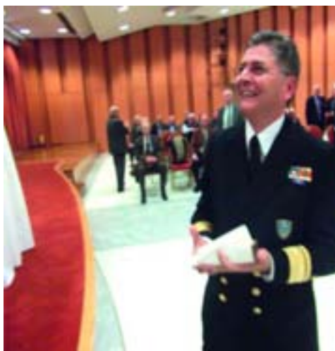
Ο τυχερός του νομίσματος Υποναύαρχος Λ.Σ. Βασίλης Μπουρνιάς

Ο πλοίσιος μπουφές που παρατέθηκε στην συνέχεια ολοκλήρωσε την εορταστική ατμόσφαιρα της ημέρας.