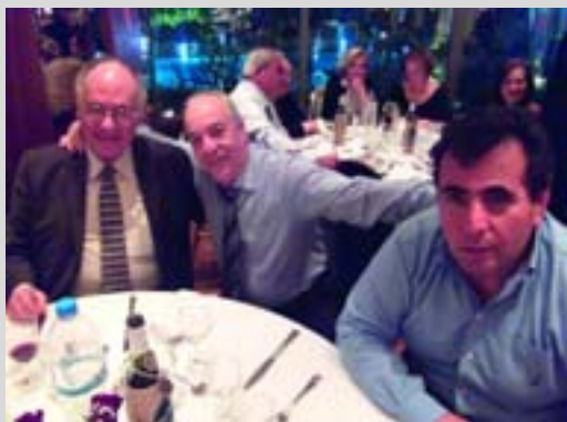
Στιγμιότυπο από τη συνεστίαση

Την αίθουσα πλημμύρησαν μέλη και φίλοι της ΕΑΑΛΣ, που τίμησαν με την παρουσία τους την ετήσια εκδήλωση της Ένωσής μας.