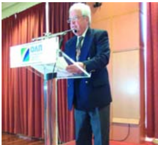
Ο Πρόεδρος ΕΑΑΛΣ Υποναύαρχος Λ.Σ. Γ. Καλαρώνης καλωσορίζει τους προσκεκλημένους κατά την κοπή πίτας 2011

Την ώρα αυτή το Λιμενικό Σώμα περνά τις δυσκολότερες ώρες της υπερεννενητάχρονης ιστορίας του. Και αποτελεί τραγική ειρωνεία το γεγονός, ότι βάσκανη μοίρα το χτύπησε ακριβώς σε χρόνο, όπου η επιτυχία ήρθε πανθομολογούμενη να στέψει μόχθους και προσπάθειες δεκαετιών. Την ώρα που Ελληνικός και Ελληνόκτητος εμπορικός στόλος διακρατεί τις πρώτες θέσεις στην παγκόσμια και Ευρωπαϊκή επετηρίδα, την ώρα που ο Ναύαρχος Λιμενικός κ. Ευθύμιος Μητρόπουλος διανύει τη δεύτερη θητεία του στην ηγεσία του Διεθνούς Ναυτιλιακού Οργανισμού, την ώρα που Λιμενικοί Αξιωματικοί σε ενέργεια και αποστρατεία, δίνουν καθημερινά επιτυχείς μάχες για την προστασία των συμφερόντων του Ελληνικού Εμπορικού πλοίου σε παγκόσμιους