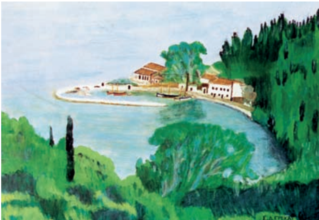
Σπύρος Γρέκας - Κέρκυρα. Ποντικονήσι