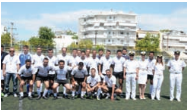
Ομάδα ποδοσφαίρου Λιμενικού Σώματος

Το πρωτάθλημα Ποδοσφαίρου Ε.Δ. & Σ.Α έτους 2012, που διοργάνωσε με μεγάλη επιτυχία το Τμήμα Αθλητισμού του Λιμενικού Σώματος, με την συνδρομή του ΑΣΑΕΔ και του Δήμου Κάτω Αχαΐας, ολοκληρώθηκε το Σάββατο 26 Μαΐου όπου έγινε και ο τελικός μεταξύ των ομάδων της Ελληνικής Αστυνομίας και του Στρατού Ξηράς στο γήπεδο της Κάτω Αχαΐας. Ο αγώνας έληξε με σκορ 3-2 υπέρ της Ομάδας της Ελληνικής Αστυνομίας, που κατέλαβε και