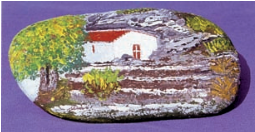
Χαράλαμπος Σπανός - Ζωγραφική πάνω σε πέτρες