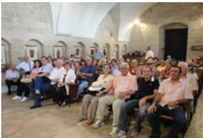
Στην αίθουσα του Συλλόγου ΧΩΡΑ ΜΑ στα Ελληνόφωνα, παρακολουθώντας την απαγγελία ποιημάτων στα γκραϊκάνικα από μέλη του Συλλόγου