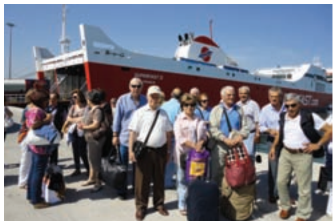
Στο λιμάνι του Μπάρι κατά την αποβίβασή μας στην Ιταλία