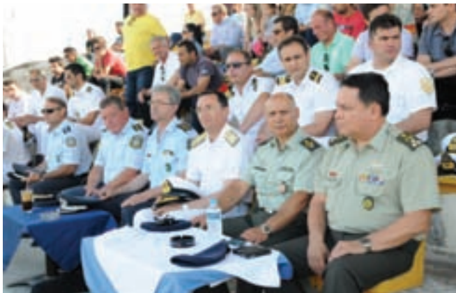
Αξιωματικοί ως εκπρόσωποι των Ε.Δ. & Σ.Α. ενώ παρακολουθούν τον τελικό αγώνα ποδοσφαίρου στο γήπεδο της Κάτω Αχαΐας