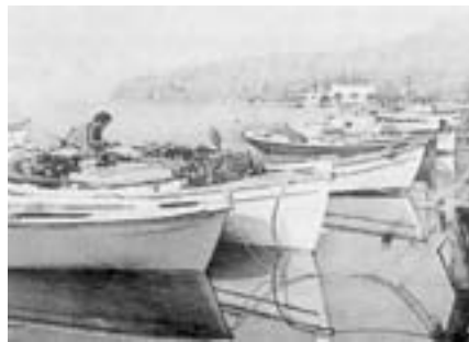
Βαρκάκια αραγμένα στη Μπέραйна

Έτσι έφτασε κι άλλο ένα Φθινόπωρο. Όλα αλλάζουνε κατά τις επιταγές της μητέρας φύσης, εκτός από τις συνήθειες του καπετάν Νικόλα. Σηκώθηκε κι αυτή την ημέρα σύναυ-