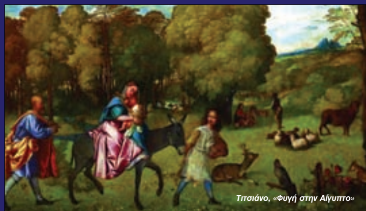
Τσιάνο, «Φυγή στην Αίγυπτο»

Αναγνωρίζουμε ότι, οι δυσχέρειες του εγχειρήματος της επαναφοράς των πραγμάτων, που τόσο βανάουσα διασαλεύτηκαν από τη φυσική τους κατάσταση τα τελευταία χρόνια, στο δρόμο της αρετής και της δημιουργίας είναι μεγάλες. Σε χρόνους ανατροπών και ανακατατάξεων είναι ενδεχόμενο τα άτομα να δυσκολεύονται να προσαρμοστούν στα νέα δεδομένα και συνεχίζουν να σκέπτονται και να συμπεριφέρονται με τρόπο σαν να βρίσκονται στην προηγούμενη περίοδο. Το κράτος όμως στην υποχρεωτική από τα πράγματα σύμπτωση και αναδιάρθρωσή του, δεν έχει αυτή την πολυτέλεια και δεν επιτρέπεται να δυστάζει και να παλινοδοεί. Για την ηγεσία εξ άλλου, την πολιτική και τη στρατιωτική, η πρόκληση είναι μοναδική και θα είναι κρίμα να αφήσει την ευκαιρία να προσμετρήσει την υστεροφημία της στην αυριανή κρίση της ιστορίας.