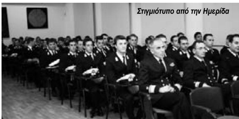
Στιγμιότυπο από την Ημερίδα

• Ο πολιτειακός ρό- λος της Αστυνομίας (και του λιμενικού)