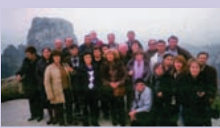
Μέλη του Συλλόγου Αποστράτων Στελεχών Νομού ΠΡΕΒΕΖΑΣ «ΝΙΚΟΠΟΛΗ» από την πρόσφατη εκδρομή τους στα ΜΕΤΕΩΡΑ ΚΑΛΑΜΠΑΚΑΣ.

Η συνεργασία με άλλους συλλόγους, ενώσεις και συνδέσμους αποστράτων των Ενόπλων Δυνάμεων και των Σωμάτων