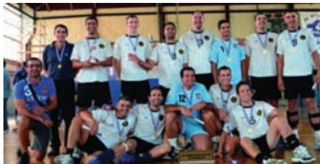
Ομάδα ΠΕΤΟΣΦΑΙΡΙΣΗΣ του Λιμενικού Σώματος

Στους αγώνες της άρσης βαρών που έγιναν στις 03 και 04 Νοεμβρίου 2012 η Ομάδα του ΛΣ - ΕΛ.ΑΚΤ κατέλαβε την 4η θέση στη Γενική Βαθμολογία κατακτώντας παράλληλα και ένα (01) χάλκινο μετάλλιο με τον αθλητή Κελευστή ΛΣ ΓΕΩΡΓΑΝΤΖΗ Μ. στα +105Κ.