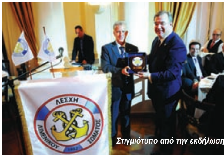
Στιγμιότυπο από την εκδήλωση

Επειδή είναι γνωστές σε όλους οι σχέσεις μου με τα εκ-